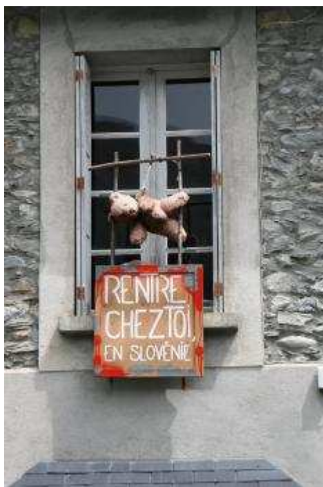
Dans un village des Pyrénées en 2008.

La semaine dernière une quarantaine de brebis sont mortes dans les estives (pâturage de montagne) d'Antras (Ariège).