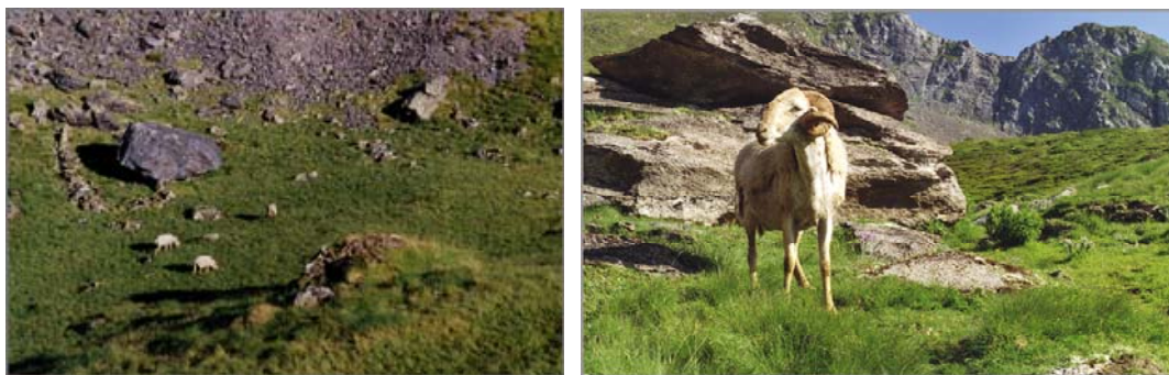
Détail de 2 = le bas du pierrier (1900 m.) et la partie basse des crêtes (2100 m +/-). A gauche, quelques brebis pâturent dans la combe. A droite, jeune bélier castillonnais sur le mamelon d'où je prends le cliché précédent.

« Ces pâtres espagnols ne font ni beurre, ni fromage, mercenaires aux gages de riches propriétaires de l'Aragon, ils conduisent en nomades d'innombrables troupeaux de moutons élevés particulièrement pour leur laine, quelques vaches pour faire des élèves /= des veaux, que leur mère élève en les faisant têter/, des juments avec leurs poulains, des chèvres enfin dont le lait sert à leur nourriture avec de très beaux pains de leur pays et la chair des moutons qui se précipitent ça et là du haut des rochers. /.../Les bergers français /.../ perdent bien moins de bétail parce qu'ils en ont moins et les conduisent moins haut /.../. »